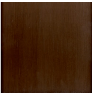
Material Aluminium eloxiert E6/C34 "dunkelbronze"