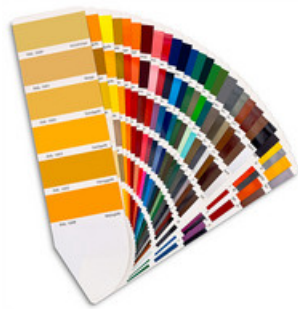
Grundmaterial pulverbeschichtet oder nasslackiert nach Farbkarte.