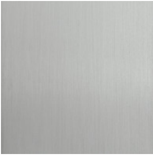
Material Aluminium eloxiert E6/EV1 "silber"