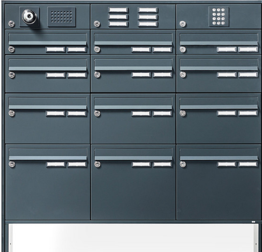
Front mit pulverbeschichteter Oberfläche