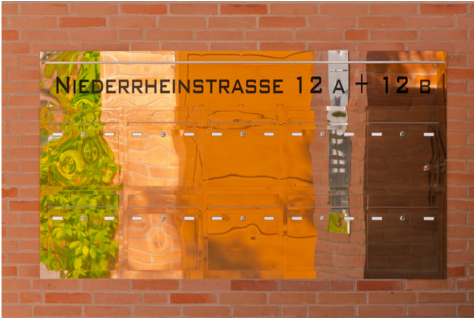
Front Messing poliert