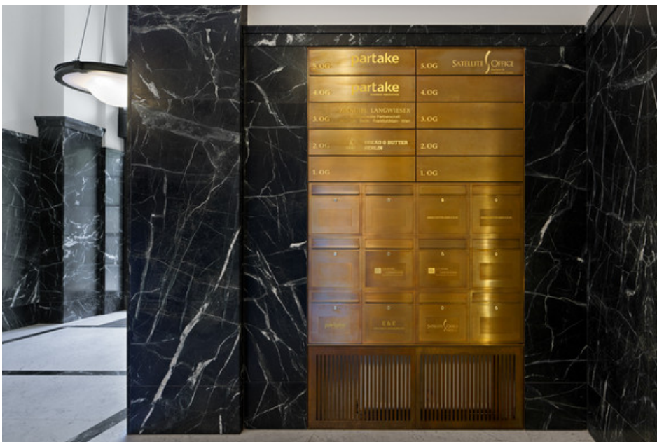
Front Messing geschliffen und patiniert "Baubronze"