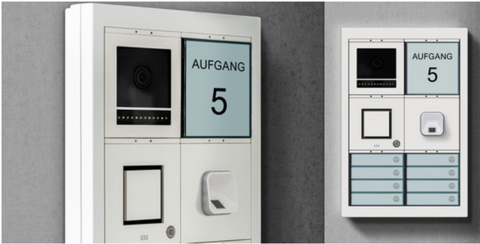
Varoflex Video- Außenstation von STR Elektronik