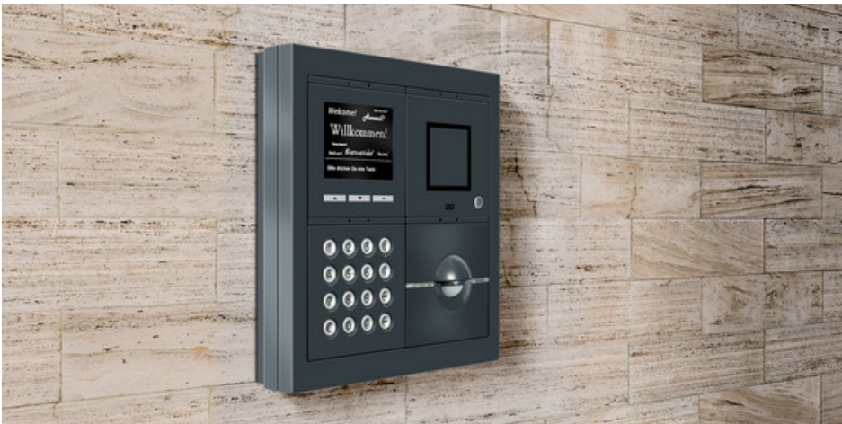
Varoflex Audio- Außenstation von STR Elektronik